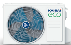
kültéri egység KEX