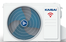
Kültéri egység KWX